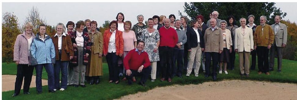
Liederkranz Königsbrunn, Kulturpreisträger der Stadt Königsbrunn. Seit Jahrzehnten prägt der Liederkranz das kulturelle Leben in Königsbrunn und darüber hinaus in starkem Maße mit. Dass nach so vielen Jahren keinerlei Spuren von Ermüdung oder gar Resignation vor den Herausforderungen der heutigen Zeit zu erkennen sind, zeigt auch immer wieder das neue, anspruchsvolle Repertoire.